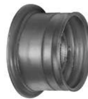
Ráfek bez zajišťovacích kruhů pro montáž superelastických kol FIX