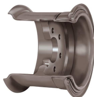
Ráfek se zajišťovacími kruhy pro montáž superelastických kol