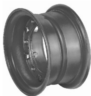
Dělený ráfek pro montáž superelastických kol